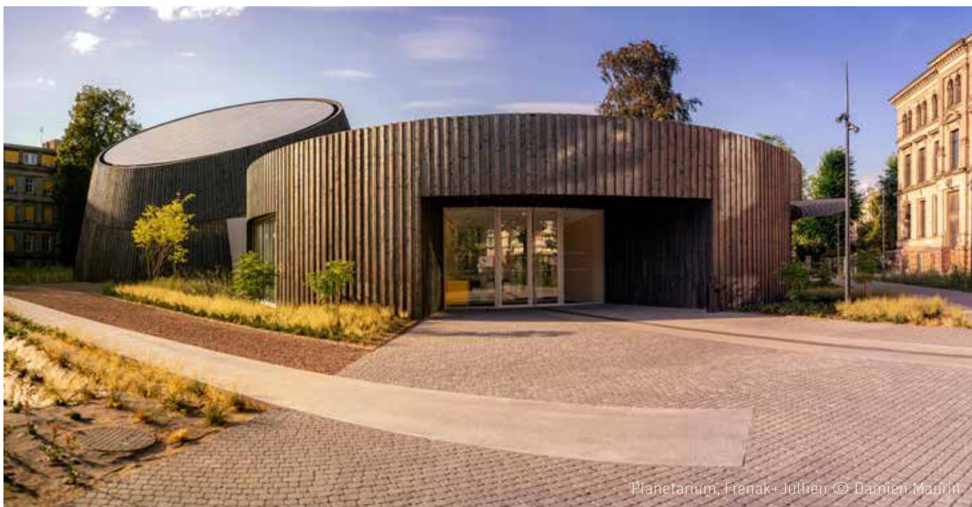
Planetarium, Frenak+Jullien