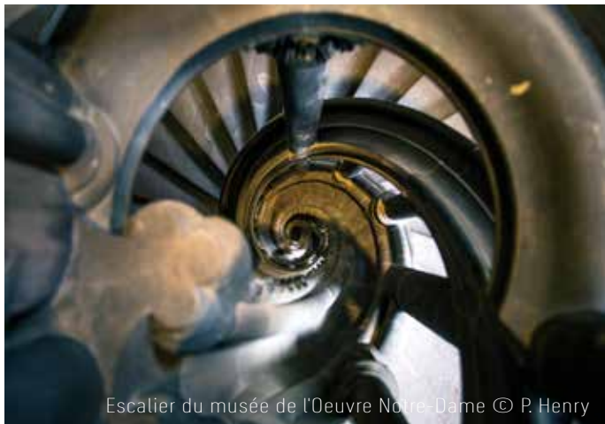
Escalier du musée de l'Oeuvre Notre-Dame

À la fin du XVI e siècle, Strasbourg est un foyer artistique éminent, dont l'activité doit beaucoup à sa position géographique privilégiée au cœur de l'Europe. L'exposition explore cette ultime saison, encore mal connue, de la Renaissance, marquée par la diffusion à travers tous les arts de la nouvelle grammaire ornementale inspirée des canons antiques et son adoption par les artistes et artisans de toutes spécialités.